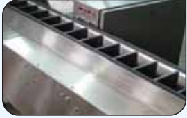
Ürün Taşıma Konveyörü Product Transport Conveyor