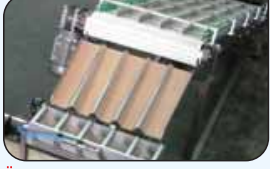
Ürün Gruplama ve Yükleme Sistemi Product Grouping & Loading System