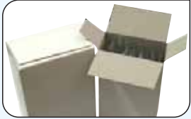
Ekstra Ölçü Kutu Seti Extra Form Set for Different Box